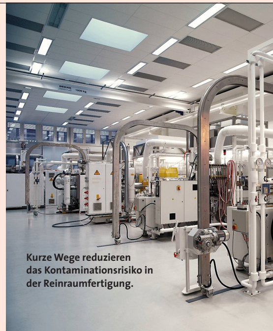
Kurze Wege reduzieren das Kontaminationsrisiko in der Reinraumfertigung.